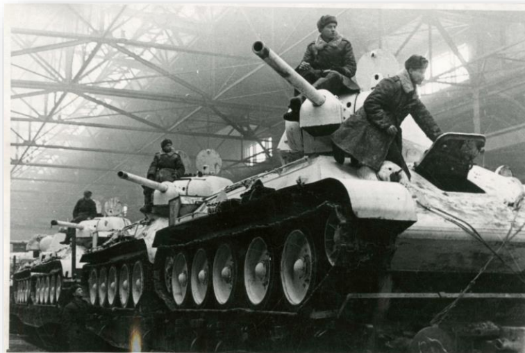
Т-34 на жд-платформах