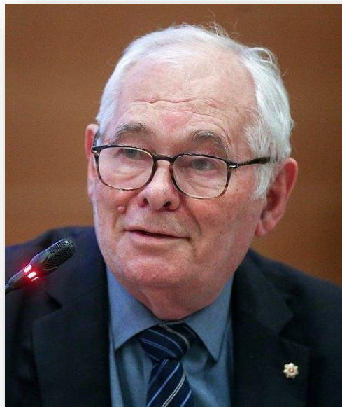
Рошалъ Леонид Михайлович